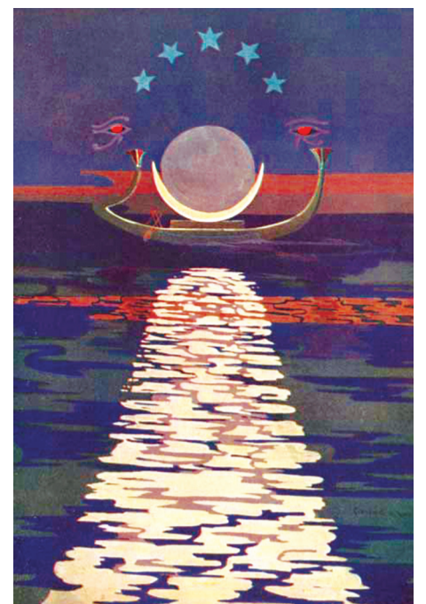
«BARK OF THE MOON, GUARDED BY THE DIVINE EYES.»